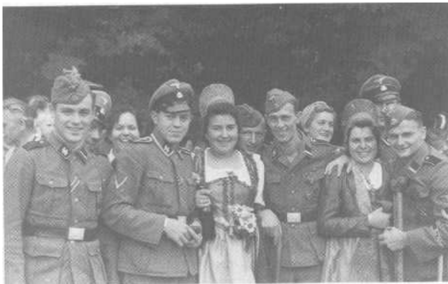
Betreuung der Kriegsversehrten in Dürnstein: eine Aufgabe des Heimatlandes und der Frauen