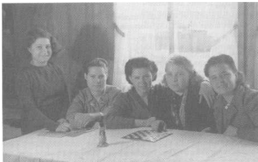
Lager für Ostarbeiterinnen in Krems Glückliche Gesichter nur für den Fotografen