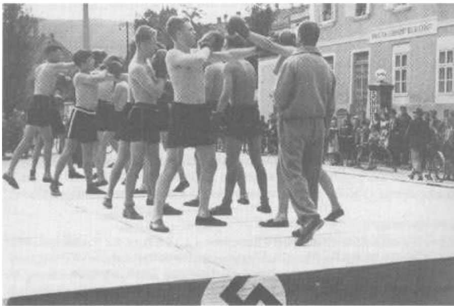
Wehrhaftmachung der Jugend