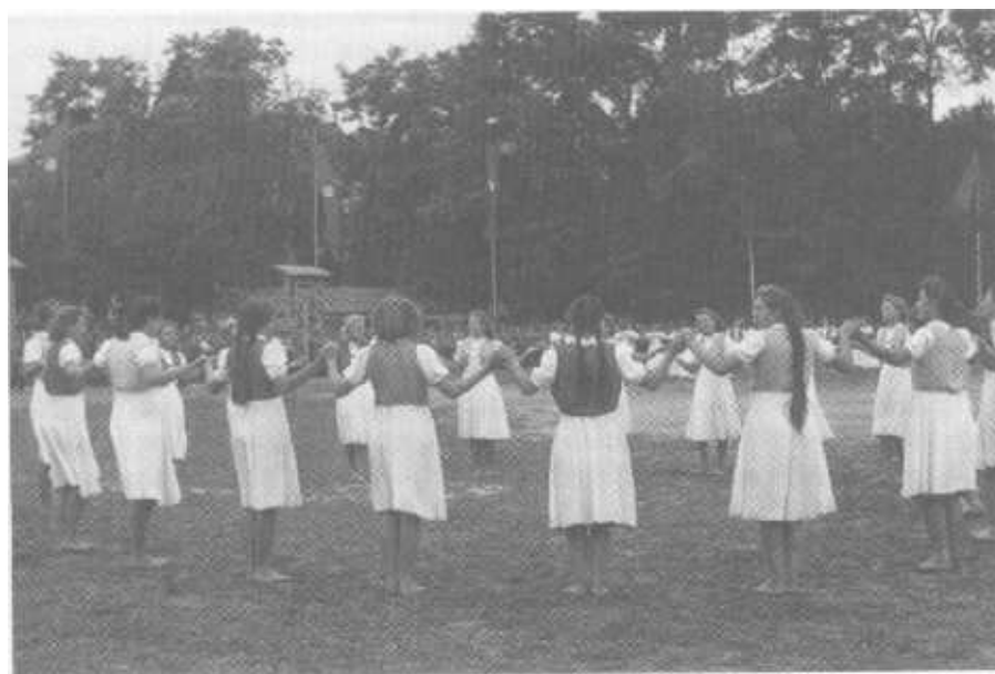
Sportfest in der „Gaustadt“ Krems