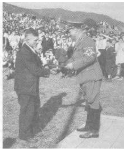
Ähre, Mais und Hakenkreuz: Erntedankfest der Wachau