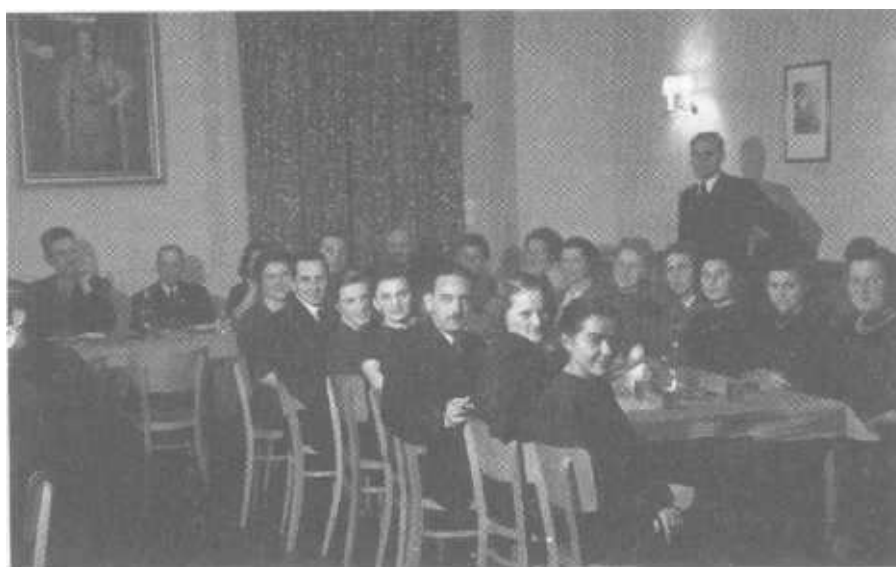
Feiern in Krems Ob Hochzeit oder Gefolgschaftsfeier, die Partei ist immer dabei