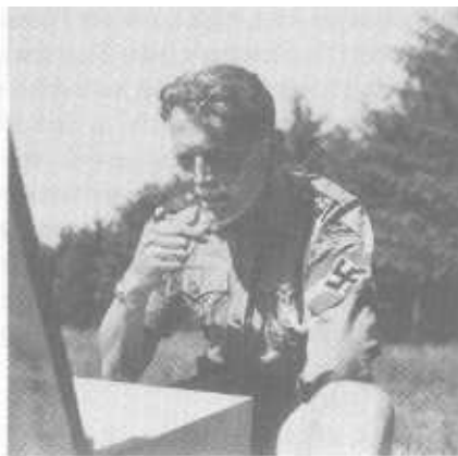
Die Romantik des Nationalsozialismus. Bergturnfest der Hitler-Jugend und des Bundes Deutscher Mädchen auf dem Jauerling