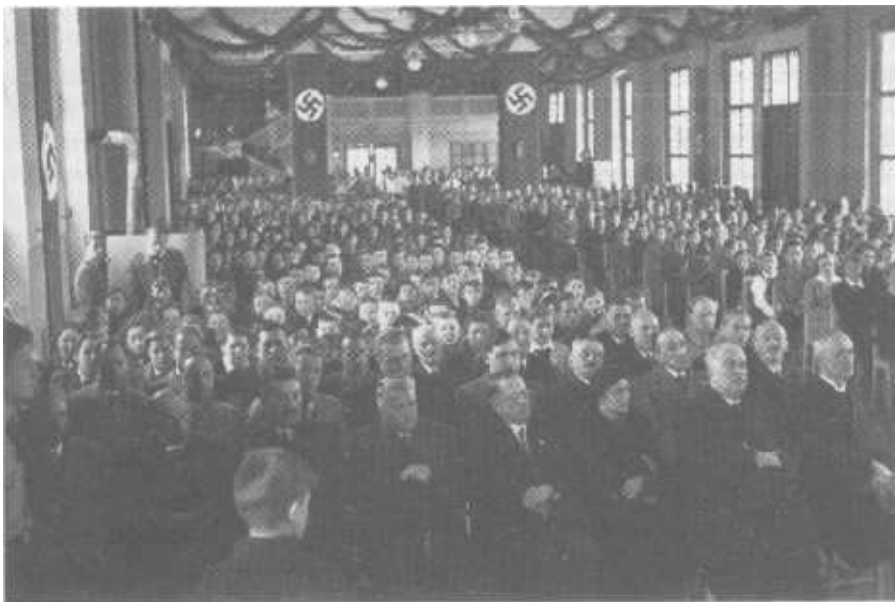
Versammlungsterror für jung und alt