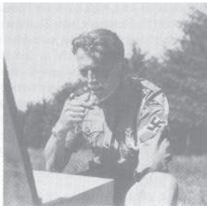
Die Romantik des Nationalsozialismus. Bergturnfest der Hitler-Jugend und des Bundes Deutscher Mädchen auf dem Jauerling