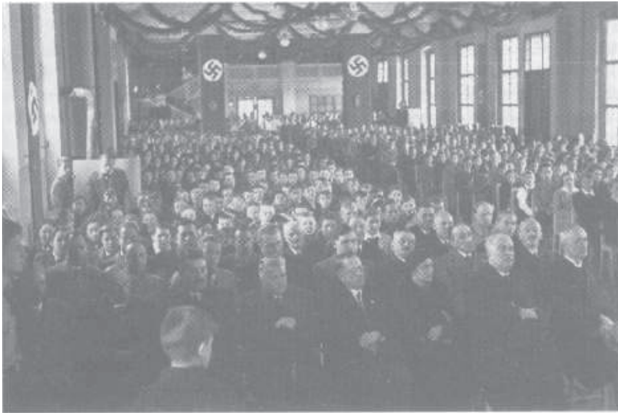
Versammlungsterror für jung und alt