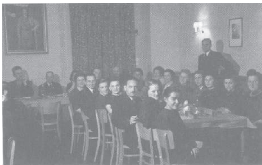
Feiern in Krems Ob Hochzeit oder Gefolgschaftsfeier, die Partei ist immer dabei