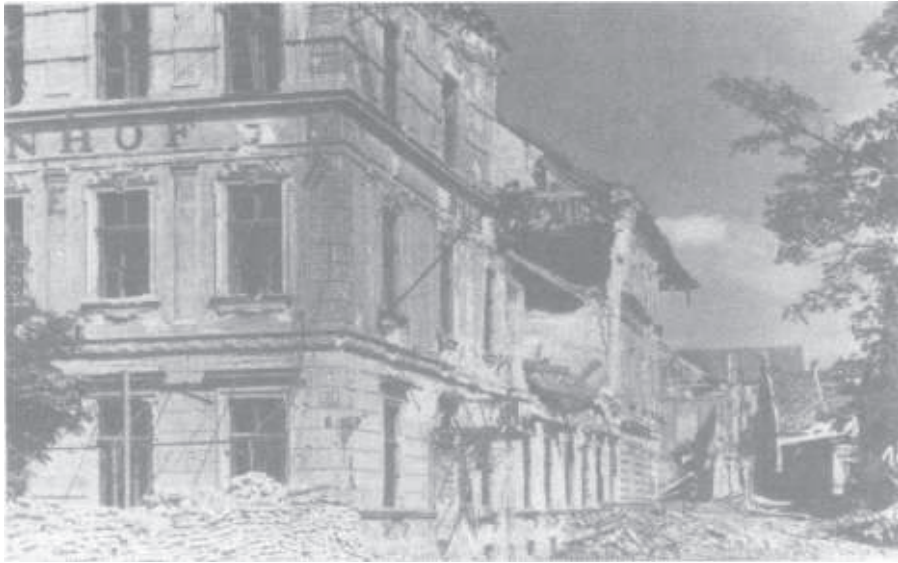
Vom Bahnhof und den umliegenden Häuserzeilen blieb nur ein Trümmerhaufen