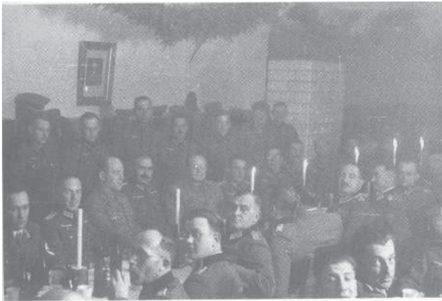
Gauleiter Dr. Jury (oben 1.v.r.) besucht ein Landeschützenbataillon, das sich vorwiegend aus Kremsern zusammensetzt, in Polen.