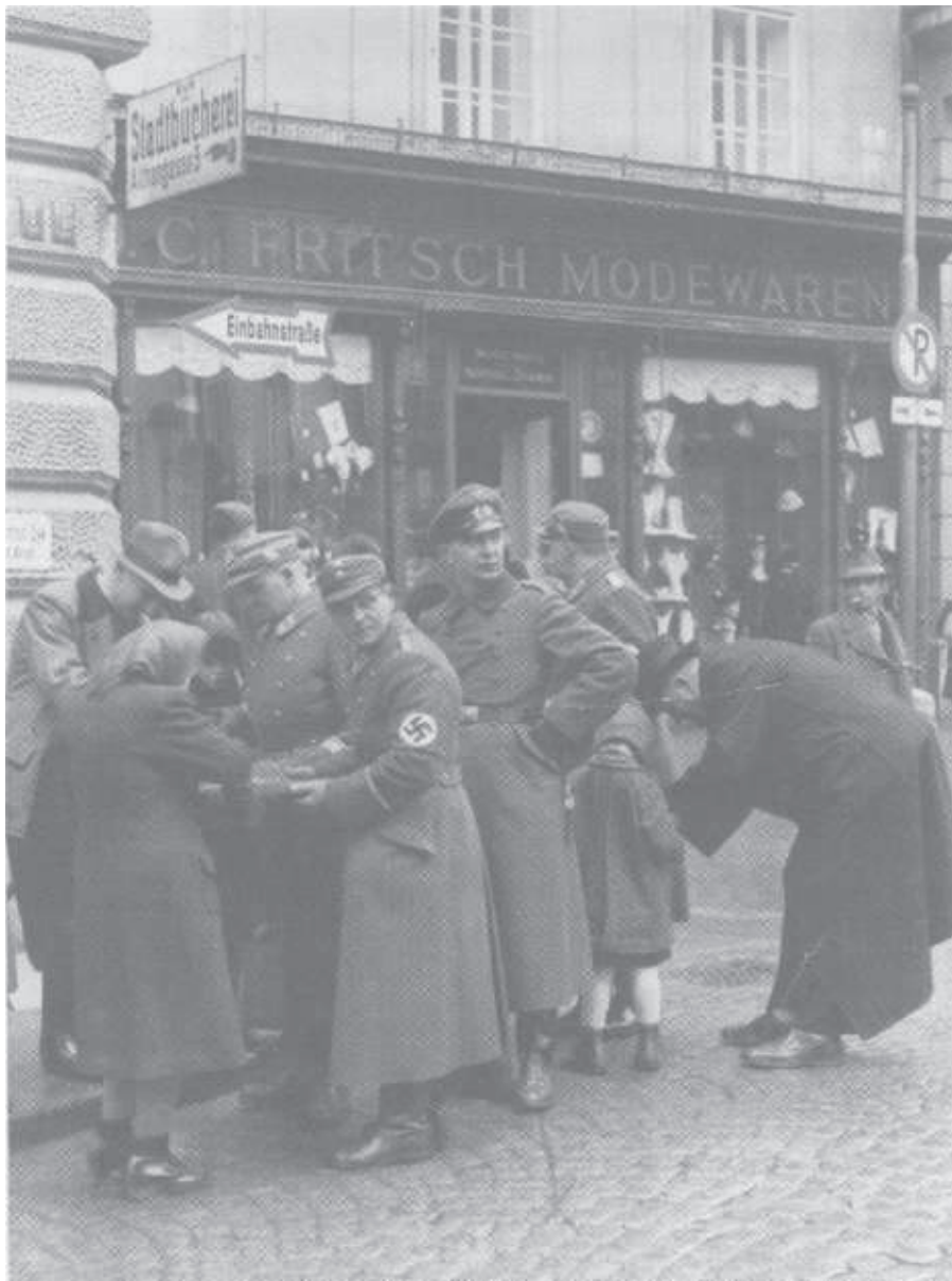
Straßensammlung für das Kriegswinterhilfswerk in der Landstraße in Kremis