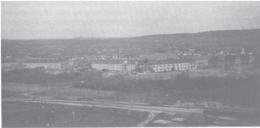
Der Bau des Walzwerkes in Lerchenfeld mit einer vorbildlichen Wohnhausanlage