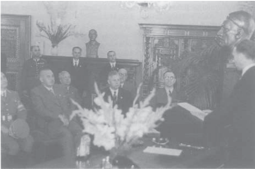
Empfang in den Räumen des Oberbürgermeisters. Als Dekoration dienen neben der Adolf-Hitler-Büste auch Antiquitäten des Stiftes Göttweig.